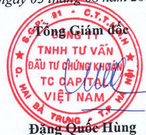
Đặng Quốc Hùng