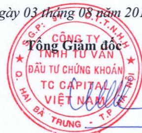
Đặng Quốc Hùng