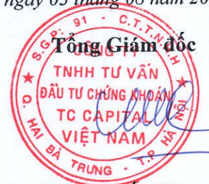
Đặng Quốc Hùng