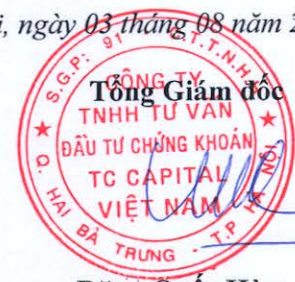
Đặng Quốc Hùng